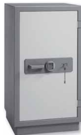
E 544 ES