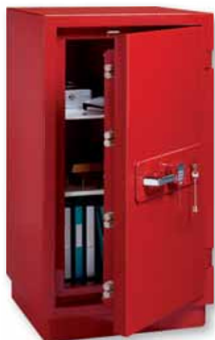
E 514 ES Peinture laquée spéciale Photo non contractuelle