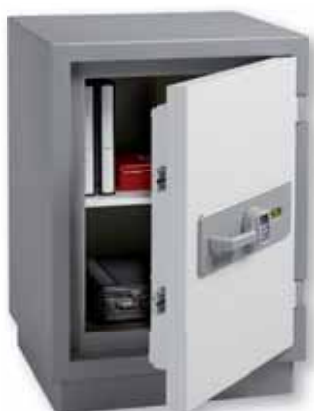
E 522 E