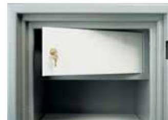
Coffre-fort intérieur IT 1