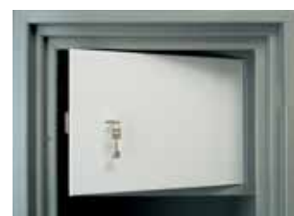
Coffre-fort intérieur IT 2