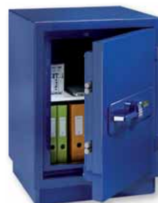
E 532 E, peinture laquée spéciale, Bleu laqué en option