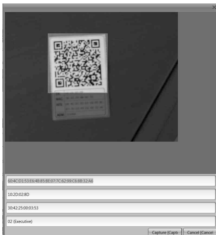
Fig. 2 : Scan code QR